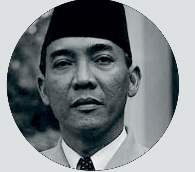
Gamal Abdel Nasser (1918-1970)