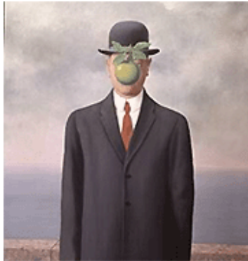
El hijo del hombre (1964), de René Magritte.