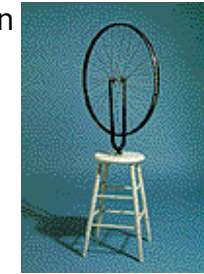
Marcel Duchamp "Bicycle Wheel", 1913

El Dadaísmo fue un movimiento que abarcó todos los géneros artísticos y fue la expresión de una protesta nihilista contra la totalidad de los aspectos de la cultura occidental, en especial contra el militarismo existente durante la Primera Guerra Mundial e inmediatamente después. Se dice que el término Dadá (palabra francesa que significa caballito de juguete) fue elegido por el editor, ensayista y poeta rumano Tristan Tzara, al abrir al azar un diccionario en una de las reuniones que el grupo celebraba en el cabaret Voltaire de Zurich. El movimiento Dadá fue fundado en 1916 por Tzara, el escritor alemán Hugo Ball, el artista alsaciano Jean Arp y otros intelectuales que vivían