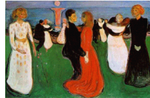
"La danza de la vida" de Edvard Munch (1899 )

Sus exponentes más destacados son el noruego Edvard Munch (1863-1944) y el austríaco Oskar Kokoschka (1886-1980)