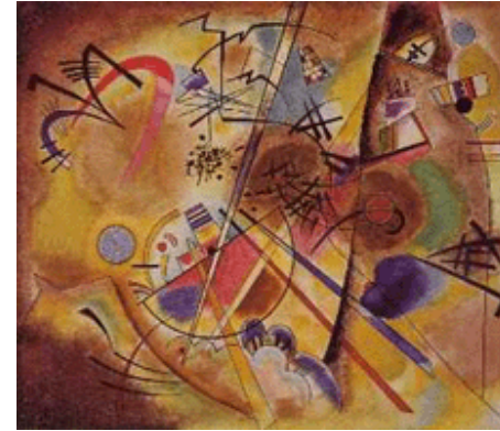
"Pequeño sueño en rojo" (1925) de Wassily Kandinsky. Kunstmuseum Bern, Berna

Las técnicas de construcción prefieren la tradición artesanal a la tecnología moderna: los chorros de pintura industrial, los grandes tamaños del formato, el uso del color y el olvido del pincel son comunes al interior de este estilo.