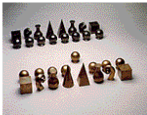
Man Ray, "Chess Set", 1926

el Zurich (Suiza), al mismo tiempo que se producía en Nueva York una revolución contra el arte convencional liderada por Man Ray, Marcel Duchamp y Francis Picabia. En París inspiraría más tarde el surrealismo. Tras la Primera Guerra Mundial el movimiento se extendió hacia Alemania y muchos de los integrantes del grupo de Zurich se unieron a los dadaístas franceses de París. En 1922 el grupo de París se desintegró.